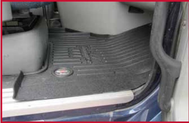
Figure 5 – Tapis côté passager découpé et installé avec le siège EzyRider

7. Faire une vérification de l'ajustement du tapis côté conducteur dans le camion. Le tapis côté conducteur est conçu pour être placé sous la pédale d'accélérateur. Pour installer le tapis côté conducteur, soulever la partie talon de la pédale d'accélérateur, puis glisser l'avant du tapis protecteur sous la pédale. Confirmer que le tapis est poussé à fond vers l'avant de manière à ce qu'il repose contre la cloison pare-feu. La Figure 6 ci-dessous montre le tapis côté conducteur installé dans un camion avec un siège d'équipementier.