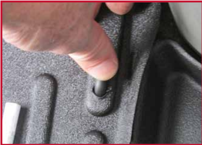
Figure 10 – Appliquer une pression sur le crochet