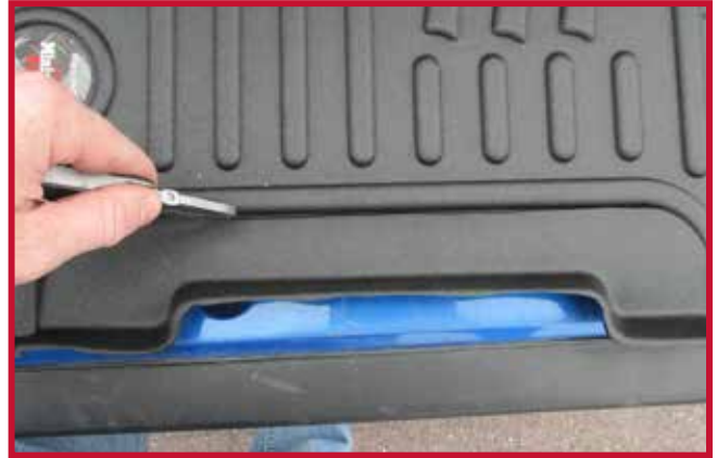
Figure 7 – Découpage du tapis côté conducteur pour installation avec un siège EzyRider ou un siège du marché de l'après-vente.

8. À l'intérieur de l'emballage contenant les directives d'installation, localiser le crochet de retenue en plastique noir et le tube blanc d'Apprêt 94, comme montré à la Figure 8.