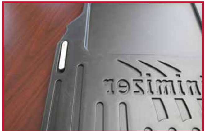
Figure 9 – Crochet inséré dans le tapis côté conducteur

10. Une fois le crochet en place, laisser le tapis côté conducteur et le crochet reposer sur le plancher du camion.