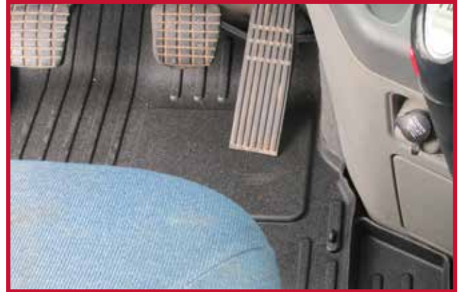
Figure 11 – Tapis côté conducteur et crochet correctement installés