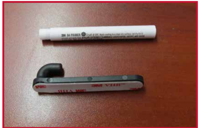
Figure 8 – Crochet de retenue et Apprêt 94

9. Insérer le crochet dans le trou situé au bord droit du tapis côté conducteur, comme montré à la Figure 9. Le crochet doit être placé à affleurement de la face inférieure du tapis côté conducteur.