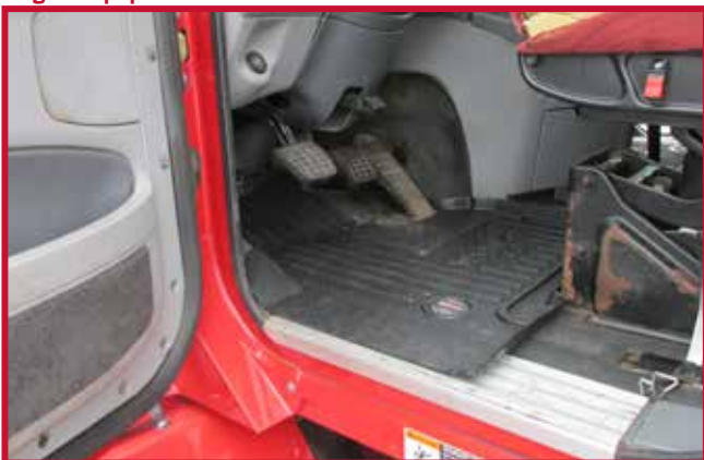
Figure 6 – Ajustement du tapis côté conducteur avec la base de siège d'équipementier

Remarque : Lors de l'installation dans des camions équipés d'un siège du conducteur EzyRider, le matériau du tapis protecteur situé derrière la nervure surélevée devra être découpé à l'aide d'un couteau à lame rétractable, comme montré à la Figure 7. La nervure surélevée est conçue pour servir de guide de couteau et pour le confinement des