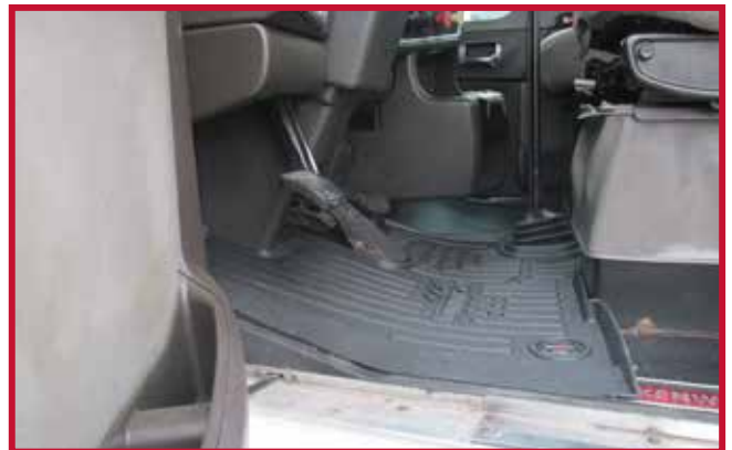
Figura 7 - Ajuste del tapete del conductor