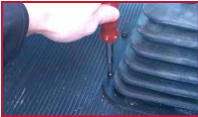
Figura 8 - Retire el tornillo de la bota de la palanca de cambios

• Introduzca el tornillo a través del orificio del gancho de retención como se muestra en la figura 7.