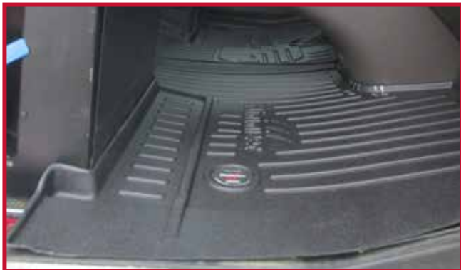
Figura 13 - Ajuste del tapete del pasajero

• Si el camión está equipado con un asiento de pasajero con caja de batería debajo del asiento, como se muestra en la figura 14, el tapete del pasajero debe recortarse para que encaje correctamente.