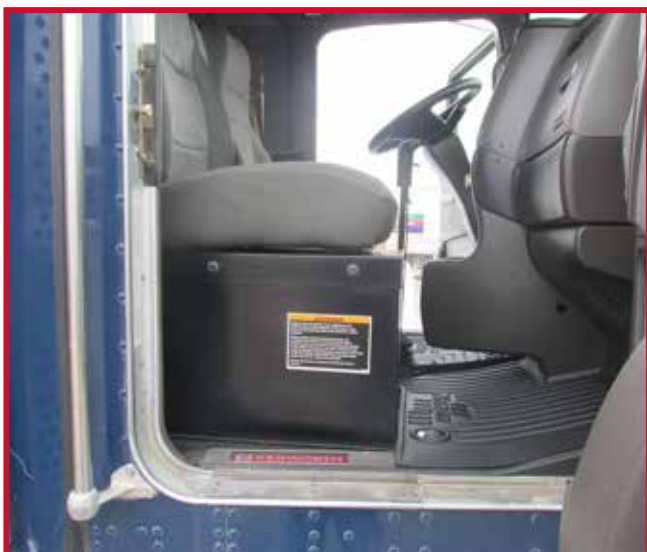
Figura 14 - Caja de la batería del asiento del pasajero con tapete recortado

• Utilice una navaja afilada para cortar el tapete. Siga a lo largo del borde interior alto y conserve el borde para la contención de líquidos. Véase el ejemplo de la figura 15.