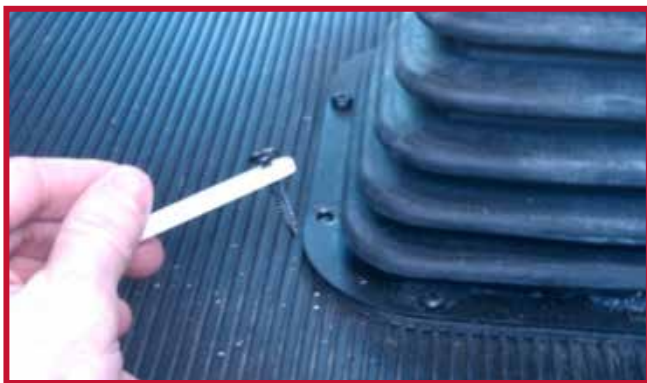
Figura 9 - Instalación del gancho en el tornillo existente

• Vuelva a colocar el tornillo en el agujero original y apriételo. Oriente el gancho del tapete para que apunte hacia la parte delantera del camión.