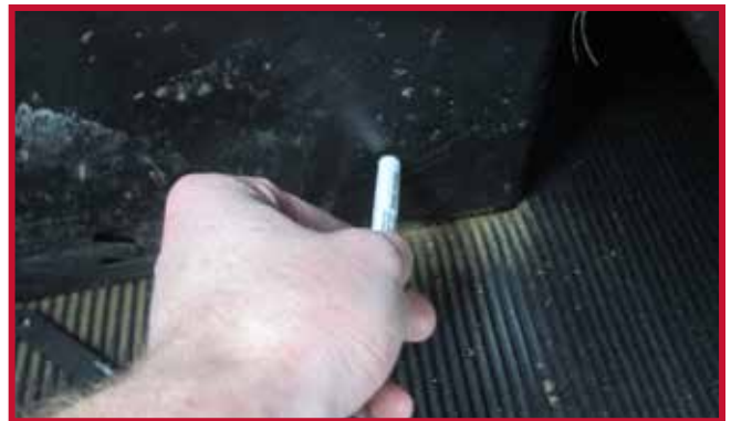
Figura 11 - Aplicar Primer 94 a la base del asiento

• Deje secar el Primer 94 sobre la superficie de la base del asiento durante 5 minutos.