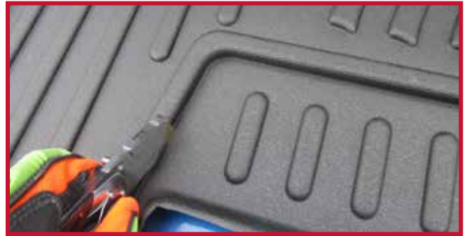
Figura 15 - Recorte del tapete del pasajero

13. Instale el gancho de retención del tapete del pasajero. Aplique Primer 94 en la zona mostrada en la figura 16 y repita el paso 7b anterior para fijar correctamente el gancho al umbral de plástico de la puerta. La figura 17 muestra una instalación correcta del gancho.