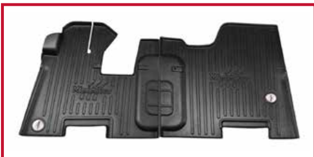
Figura 4 - Kit de tapetes 10002650