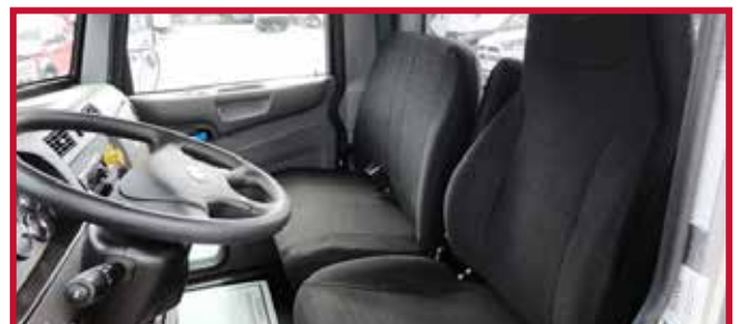
Figura 7 - Asiento de banco para dos personas