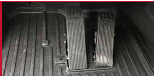
Figura 14 - Tapete del conductor instalado con gancho

12. Tire del tapete del conductor para confirmar que el gancho está completamente encajado en el tapete. Si el gancho no funciona correctamente o el tapete no puede instalarse de forma segura, no utilice un tapete Minimizer en el lado del conductor del vehículo.