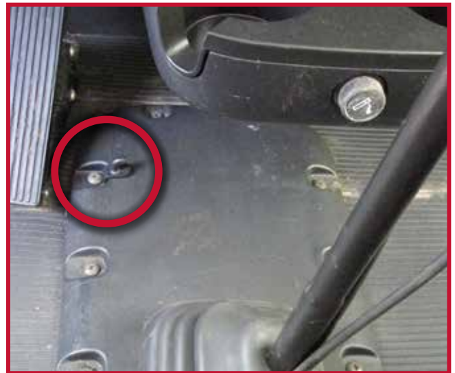
Figura 15 - Perno de montaje del pedal de freno

17. Antes de utilizar el vehículo, lea las instrucciones de seguridad para el manejo del vehículo.