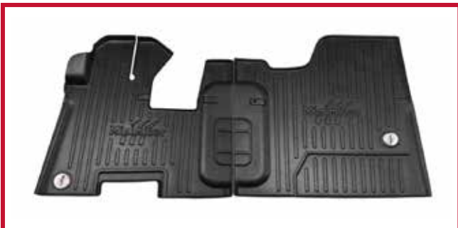
Figura 10 - Kit de tapetes 10002655