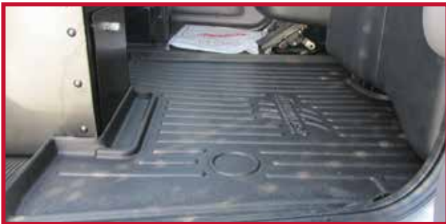
Figura 2 - Asiento del pasajero con compartimento de almacenamiento