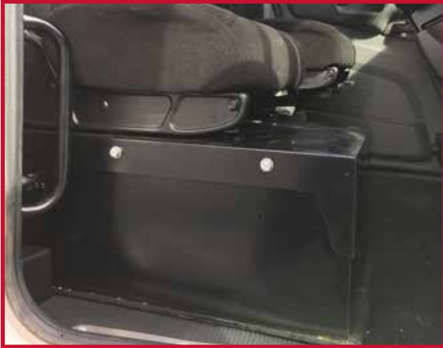
Figura 8 - Caja de la batería con base del asiento del pasajero