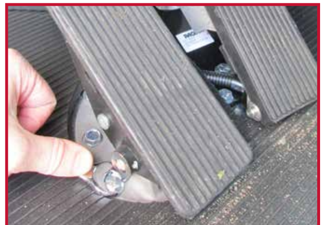
Figura 12 - Perno de montaje del pedal de freno