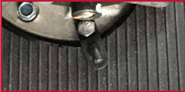
Figure 13 – Crochet de retenue et quincaillerie

11. Placer le tapis côté conducteur dans le camion et fixer le tapis au crochet de retenue.