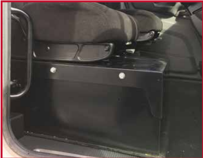
Figure 8 – Base de siège du passager avec caisson de batterie