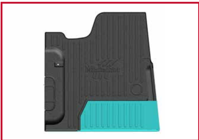
Figure 9 – Schéma de découpage