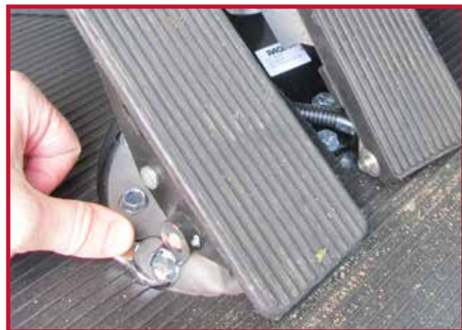
Figure 12 – Boulon de montage de la pédale de frein