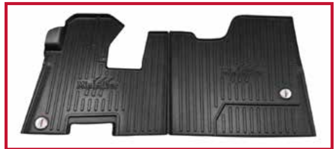
Figure 6 – Trousse de tapis protecteurs 10002652