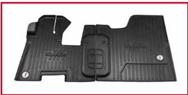
Figure 10 – Trousse de tapis protecteurs 10002655