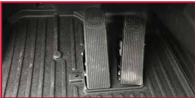
Figure 14 – Tapis côté conducteur installé avec le crochet

12. Tirer sur le tapis côté conducteur pour confirmer que le crochet est entièrement engagé dans le tapis. Si le crochet ne fonctionne pas correctement ou si le tapis ne peut pas être installé de manière sûre, ne pas utiliser de tapis protecteur Minimizer du côté conducteur du véhicule.