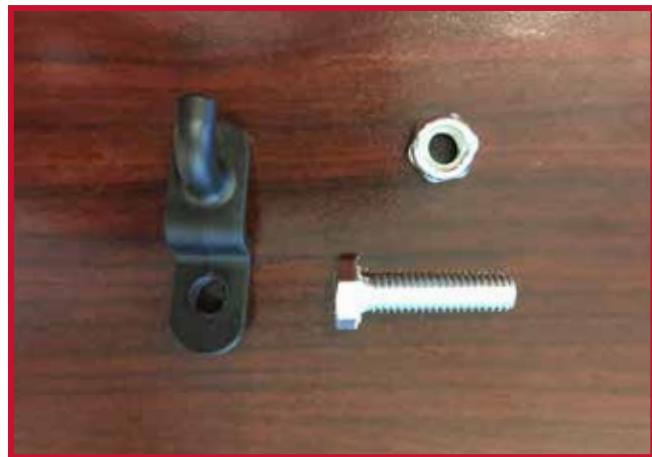
Figure 11 – Crochet de retenue et quincaillerie