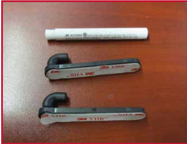
Figure 5 – Crochet de retenue et Apprêt 94

8. Insérer un crochet dans le trou situé au bord droit du tapis côté conducteur. Le crochet doit être placé à affleurement de la face inférieure du tapis côté conducteur.