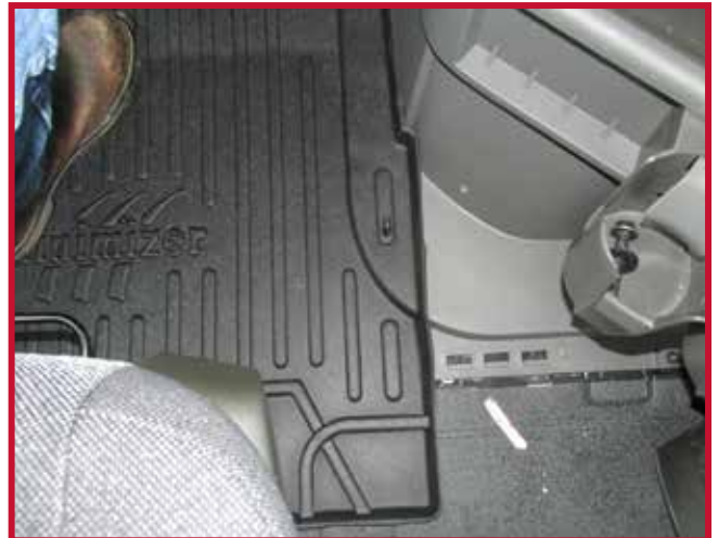
Figure 7 – Installation du crochet du tapis côté conducteur

18. Tirer le tapis côté conducteur vers l'arrière du camion pour confirmer que le crochet est entièrement engagé dans le tapis et que le crochet est collé à la moulure. Si le crochet ne fonctionne pas correctement ou si le tapis ne peut pas être installé de manière sûre, ne pas utiliser de tapis protecteur Minimizer du côté conducteur du véhicule.