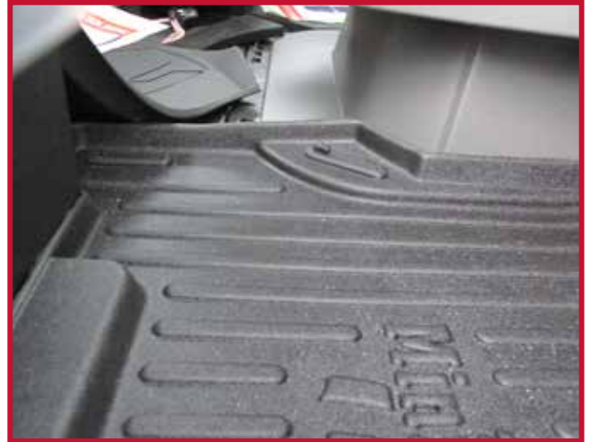
Figure 9 – Emplacement du crochet de retenue du tapis côté passager

23. Avant d'utiliser le véhicule, lire les Consignes de sécurité relatives au fonctionnement du véhicule.