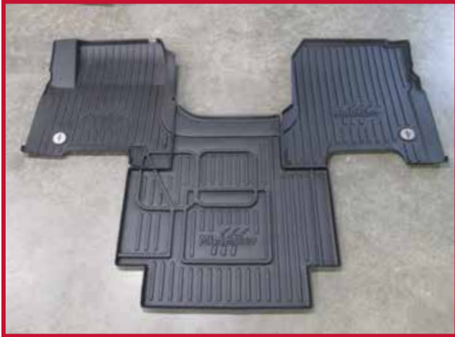
Figure 1 – Trousse de tapis protecteurs 10002792