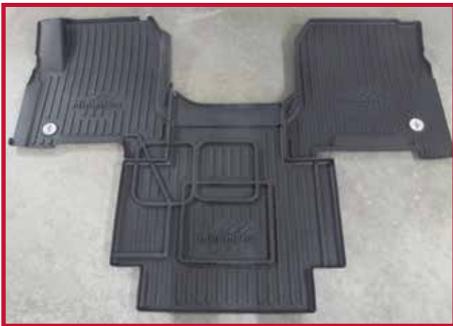
Figure 2 – Trousse de tapis protecteurs 10002798