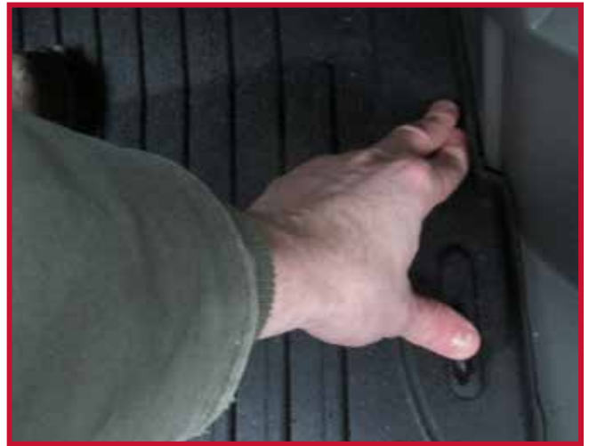
Figure 6 – Appliquer une pression sur le crochet

17. Pour une adhérence optimale, ne pas déranger le crochet pendant une période de 20 minutes après l'installation. La Figure 7 ci-dessous montre le tapis côté conducteur et le crochet correctement installés.