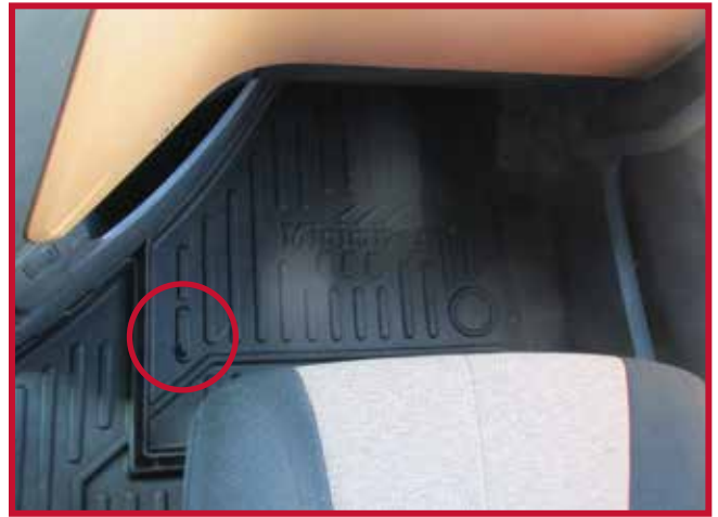
Figura 10 - Ubicación del gancho de retención del tapete del pasajero

23. Antes de utilizar el vehículo, lea las instrucciones de seguridad para el manejo del vehículo.