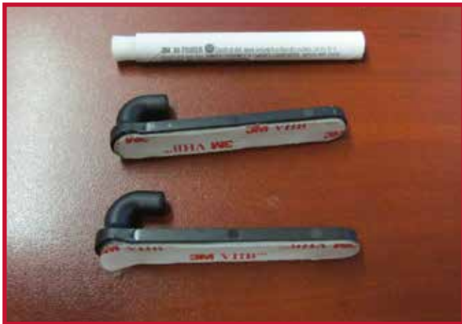
Figura 6 - Gancho de retención y Primer 94

8. Introduzca un gancho a través del orificio situado en el borde derecho del tapete del conductor. El gancho debe quedar al ras de la parte inferior del tapete del conductor.