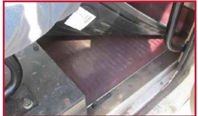
Figura 11 - Gancho del tapete del pasajero en posición

18. Confirme que el gancho de retención está completamente encajado en el tapete del conductor y que el gancho está adherido al piso. Si el gancho de retención del tapete del conductor no funciona correctamente o el tapete no puede instalarse de forma segura, no utilice un tapete Minimizer en el lado del conductor del vehículo.