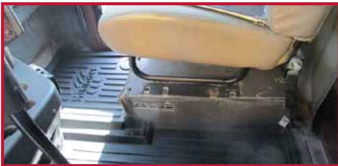
Figura 1 - Interior Premium (sin portavasos)