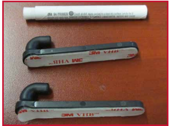
Figura 6 - Recinto eléctrico del lado del conductor y tapete del piso