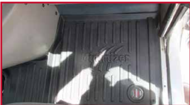
Figura 10 - Tapete del pasajero en posición

17. Utilice el mismo proceso indicado en los pasos 7-14 anteriores para fijar el gancho de retención del tapete del pasajero al piso. Siga los mismos pasos básicos para aplicar Primer 94 en la superficie y fijar el gancho al piso de la cabina como se muestra en la figura 11.