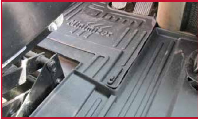
Figura 9 - Gancho del tapete del conductor en posición

Marque la posición aproximada en la que debe fijarse el gancho al piso. Una vez localizada la posición, retire el tapete del conductor del camión.