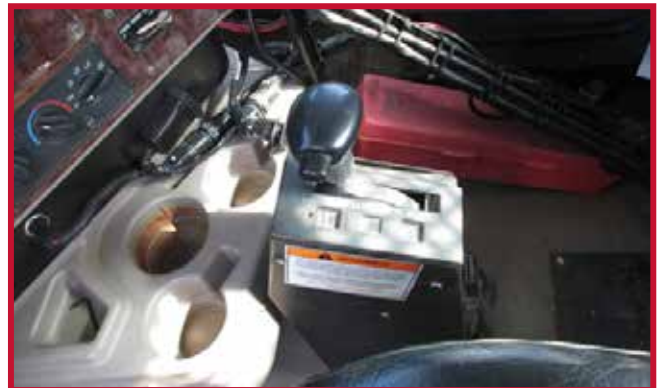
Figura 8 - Torre de control montada en el piso

Nota: Algunos camiones más antiguos con transmisiones automáticas están equipados con una torre de control que se fija al piso como se muestra en la figura 8. Es necesario recortar a mano el tapete central para que sea compatible con las torres de control montadas en el piso.