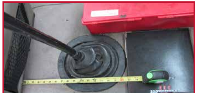
Figura 3 - Medida desde el panel central inferior del tablero hasta la palanca de cambios