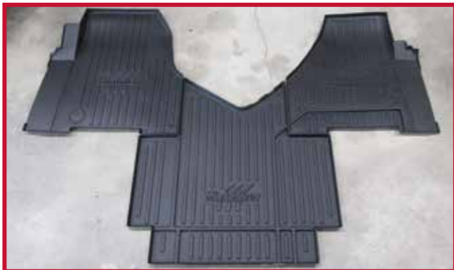
Figure 2 – Contenu de la trousse 10002323