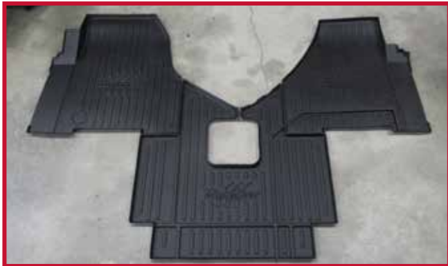
Figure 1 – Contenu de la trousse 10002331