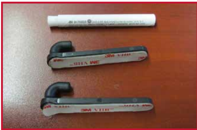
Figure 6 – Crochet de retenue et Apprêt 94

8. Insérer un crochet dans le trou situé au bord droit du tapis côté conducteur. Le crochet doit être placé à affleurement de la face inférieure du tapis côté conducteur.