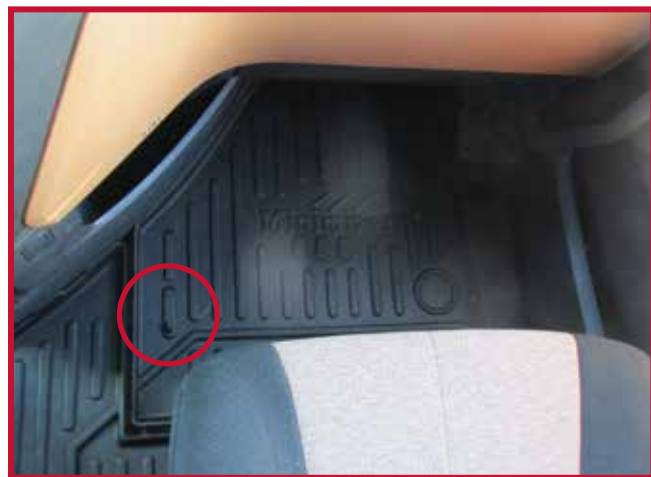
Figure 10 – Emplacement du crochet de retenue du tapis côté passager

23. Avant d'utiliser le véhicule, lire les Consignes de sécurité relatives au fonctionnement du véhicule.