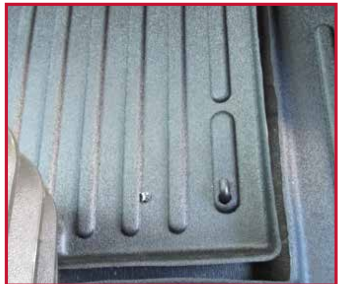
Figure 8 – Installation du crochet du tapis côté conducteur

17. Pour une adhérence optimale, ne pas déranger le crochet pendant une période de 20 minutes après l'installation. La Figure 8 ci-dessous montre le tapis côté conducteur et le crochet correctement installés.