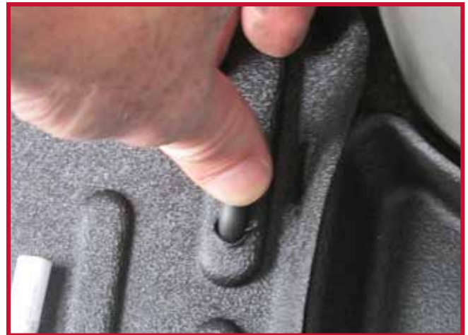
Figure 7 – Appliquer une pression sur le crochet

17. Pour une adhérence optimale, ne pas déranger le crochet pendant une période de 20 minutes après l'installation. La Figure 8 ci-dessous montre le tapis côté conducteur et le crochet correctement installés.