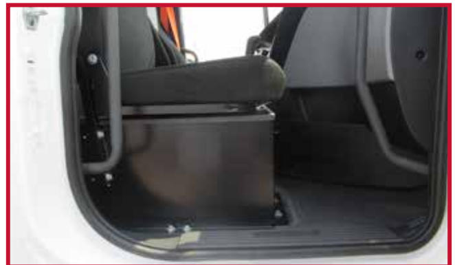
Figure 5 – Découpage du tapis central pour le caisson de batterie