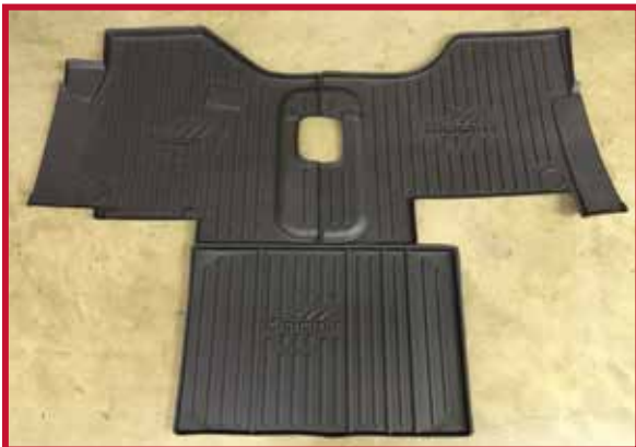
Figura 3 - Contenido del KIT #10002647