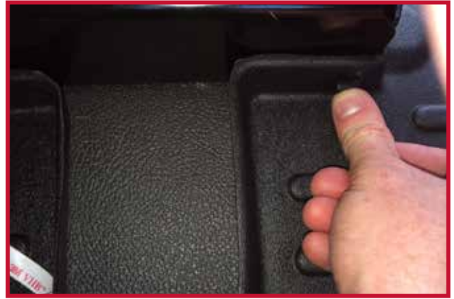
Figura 11 - Aplicar presión al gancho

8. SI NO SE INSTALA CORRECTAMENTE EL GANCHO DE RETENCIÓN DEL TAPETE DEL LADO DEL CONDUCTOR, EL TAPETE PUEDE DESPLAZARSE, LO QUE PUEDE INTERFERIR CON EL FUNCIONAMIENTO CORRECTO DE LOS PEDALES DEL VEHÍCULO, PUDIENDO PROVOCAR LA PÉRDIDA DE CONTROL DEL VEHÍCULO Y LESIONES GRAVES O LA MUERTE.