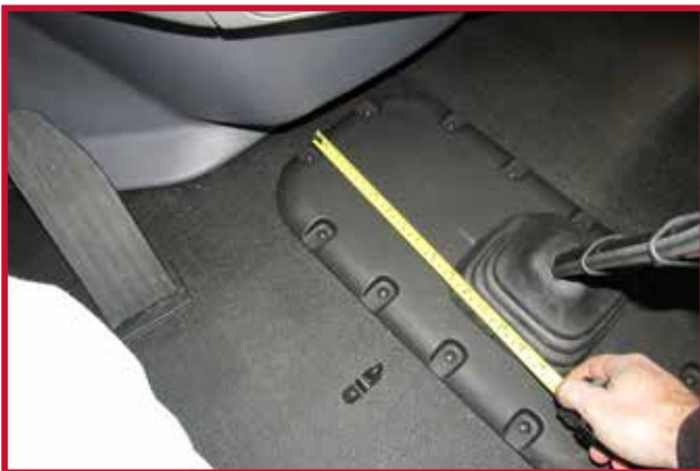
Figura 7 - Conjunto de gancho y espaciador

b) Localice el gancho de retención suministrado en el kit del tapete del piso. Introduzca el tornillo a través del orificio del gancho de retención y vuelva a colocar el tornillo en la cubierta de la transmisión. Apriete el