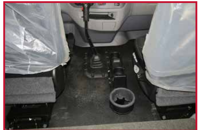
Figura 5 - Soporte para termos