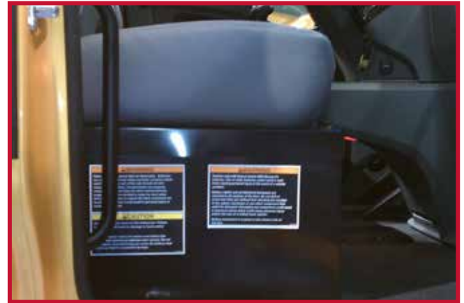
Figura 4 - Asiento del pasajero con almacenamiento de la batería