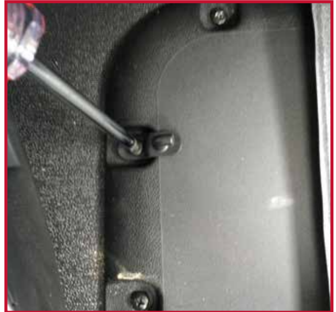
Figura 8 - Instalación del gancho de retención

d) Termine de instalar el tapete del lado del conductor y engánchelo en el gancho de retención. El tapete del conductor debe empujarse completamente hacia adelante para que el borde delantero haga pleno contacto con los paneles inferiores del salpicadero, como se muestra en la figura 9.