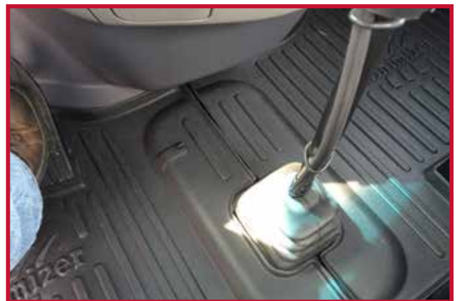
Figura 9 - Kit #10002633 Tapete de conductor con gancho de retención

• Instalación del gancho de retención para el kit #10002608