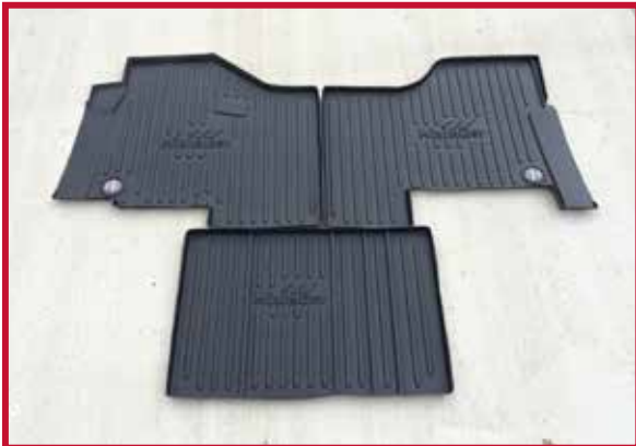
Figura 2 - Contenido del KIT #10002608