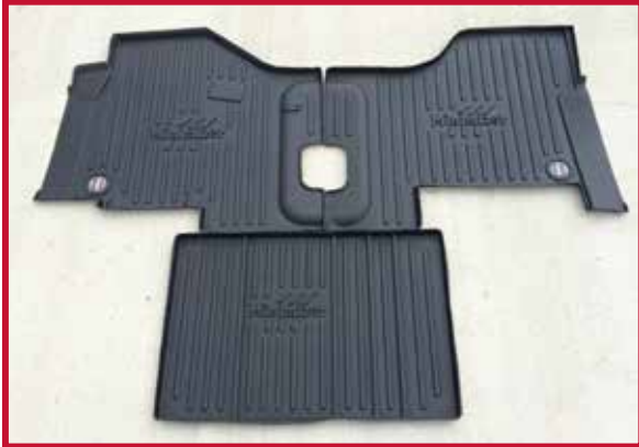
Figura 1 - Contenido del KIT #10002633