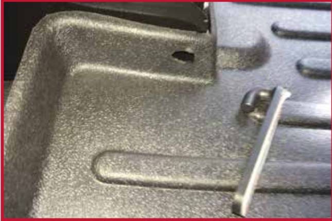
Figura 10 - Tapete del conductor con abertura para el gancho

d) El gancho de retención se fijará en el lado derecho de la base del asiento del conductor. En la pared vertical del tapete del conductor hay un orificio ranurado, como se muestra en la figura 10.