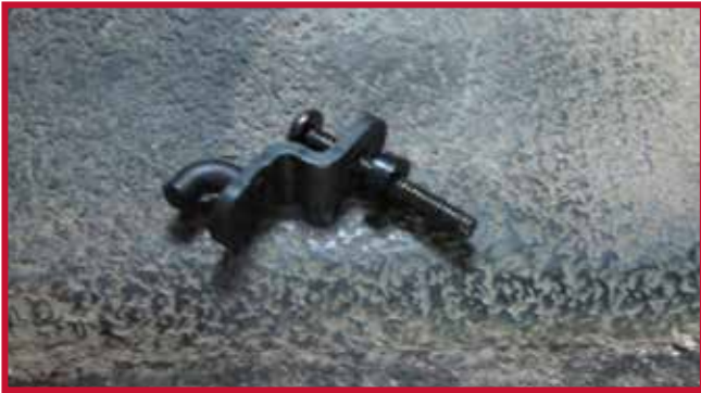
Figure 6 – Assemblage de crochet et d'espaceur

c) Introduzca el conjunto del gancho a través de la tapa de la transmisión y apriételo con un desarmador Phillips n° 3. Oriente el gancho del tapete para que apunte directamente hacia la palanca de cambios, como se muestra en la figura 7.