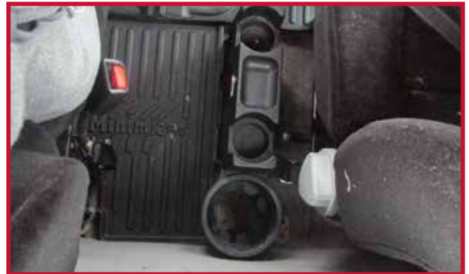
Figura 3 - Soporte para termos de fábrica

6. En los casos en los que se monta un extintor detrás del asiento del conductor, la esquina trasera izquierda del tapete central sombreada en amarillo puede recortarse para dejar espacio libre.