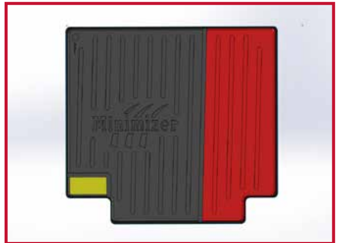
Figura 4 - Diagrama de recorte

7. A continuación, instale el tapete para el lado del pasajero del vehículo.