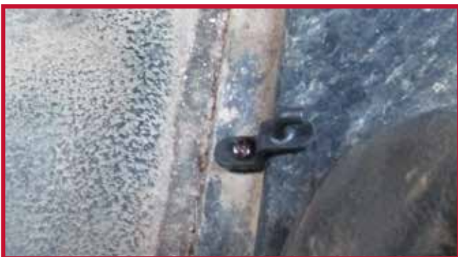
Figure 7 – Orientation appropriée du crochet

9. Instale el tapete del lado del conductor y encájelo en el gancho de retención. Si la posición de la base del asiento no es estándar o si el camión está equipado con asientos del mercado de accesorios, puede ser necesario recortar la parte trasera del tapete del conductor o del pasajero para que encaje. El tapete del conductor y del pasajero tiene un borde elevado para contener los líquidos y servir de guía para el corte. Utilice una navaja afilada como se muestra en la figura 8 para recortar el material y cortar a lo largo de la parte exterior del borde elevado, preservando el borde para la contención de líquidos.