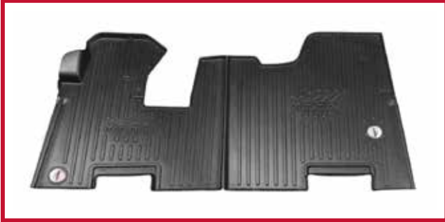
Figura 1 - Kit de tapetes 10002732