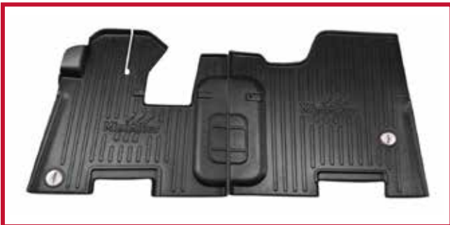
Figura 4 - Kit de tapetes 10002650