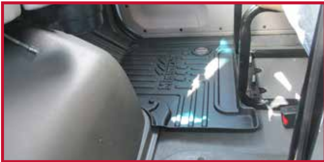
Figura 13 - Gancho del tapete del pasajero instalado en la moldura de la cabina

17. Confirme que el gancho de retención está totalmente encajado en el tapete del conductor y que el gancho está adherido al piso. Si el gancho del tapete del conductor no funciona correctamente o el tapete no puede instalarse de forma segura, no utilice un tapete Minimizer en el lado del conductor del vehículo.