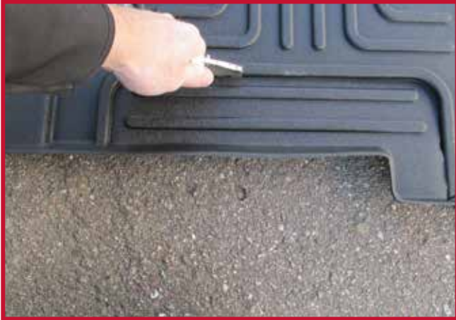
Figura 8 - Recorte para el asiento EzyRider

PRECAUCIÓN: Los tapetes Minimizer están diseñados para ser utilizados con el piso de fábrica en buen estado. Si el piso de fábrica está en mal estado (tiene protuberancias o burbujas) debido a un exceso de humedad, es posible que el tapete no se asiente correctamente. Si el tapete no se asienta correctamente, existe el riesgo de que el tapete interfiera con los pedales del freno y del acelerador.