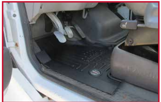
Figura 7 - Instalación del tapete del conductor con el asiento EzyRider