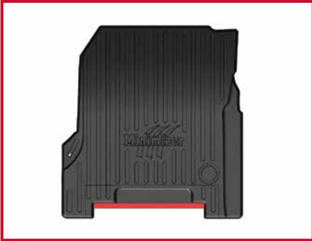
Figura 8 - Diagrama de recorte del tapete del pasajero

22. Instale el gancho de retención del tapete del pasajero como se muestra en la figura 9. Repita los pasos 9-16 anteriores para fijar correctamente el gancho a la moldura de plástico cerca del piso del camión.