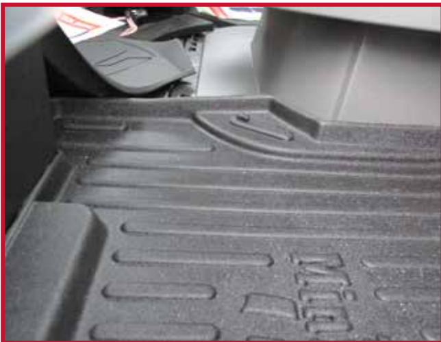
Figura 9 - Ubicación del gancho de retención del tapete del pasajero

23. Antes de utilizar el vehículo, lea las instrucciones de seguridad para el manejo del vehículo.