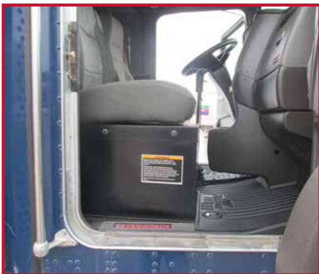
Figure 14 – Caisson de batterie du siège du passager avec tapis protecteur découpé

• Utiliser un couteau à lame rétractable bien aiguisée pour découper le tapis. Suivre le long du bord intérieur de la nervure haute et conserver la nervure pour le confinement des liquides. Voir l'exemple à la Figure 15.