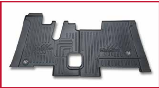
Figure 4 – Trousse de tapis protecteurs 10002508