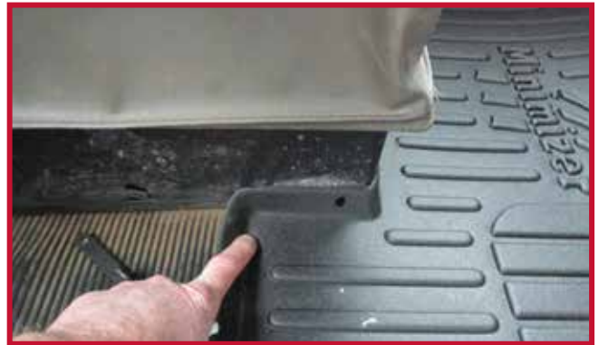
Figure 10 – Emplacement du crochet du tapis côté conducteur

• Retirer le tapis côté conducteur du camion.