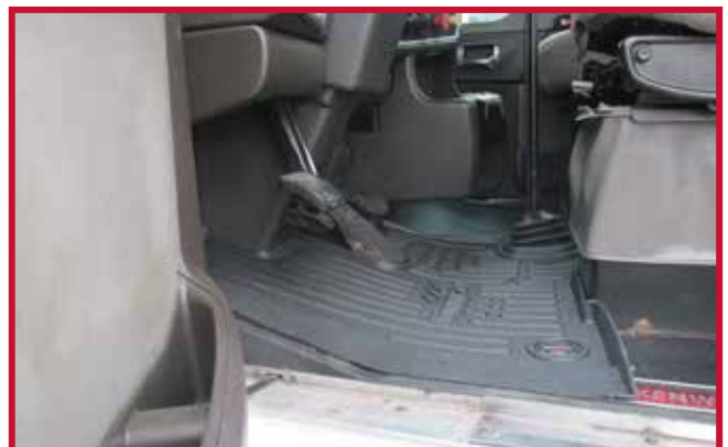
Figure 7 – Ajustement du tapis côté conducteur