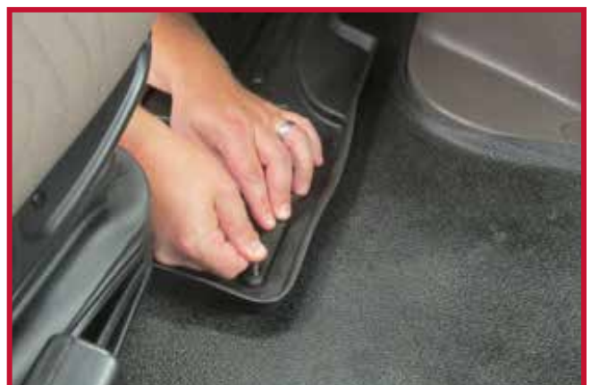
Figure 12 – Appliquer une pression sur le crochet

• Pour une adhérence optimale, ne pas déranger le crochet pendant une période de 20 minutes après l'installation.