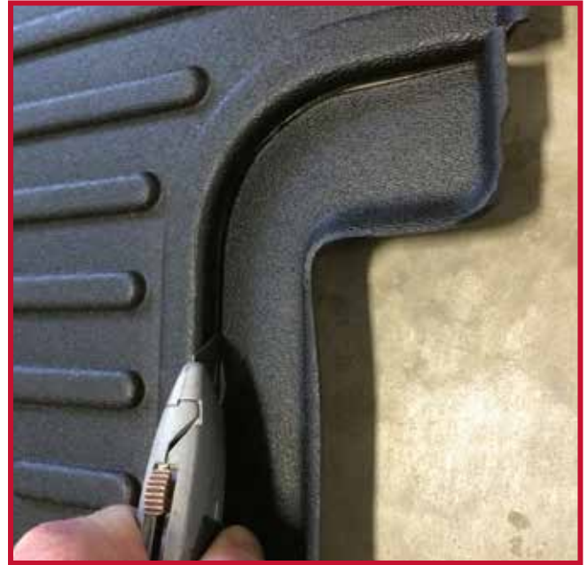
Figure 8 – Découpage pour les sièges du marché de l'après-vente

10. Tirer le tapis protecteur côté conducteur vers la gauche pour s'assurer que le crochet de retenue est entièrement engagé et solidement fixé au plancher. Si le crochet ne fonctionne pas correctement ou si le tapis ne peut pas être installé de manière sûre, ne pas utiliser de tapis protecteur Minimizer du côté conducteur du véhicule.