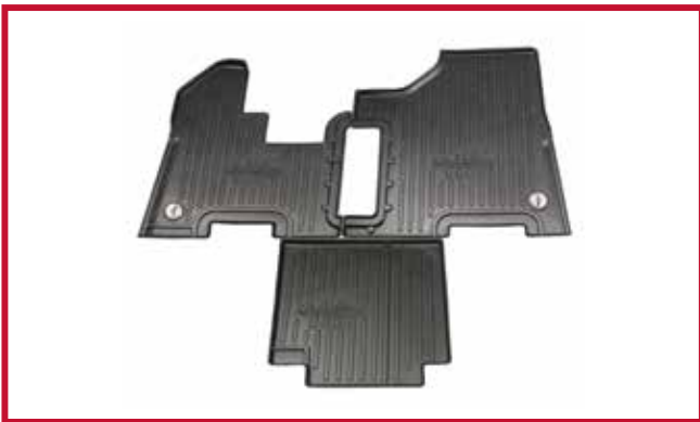
Figure 2 – Contenu de la trousse 10002712