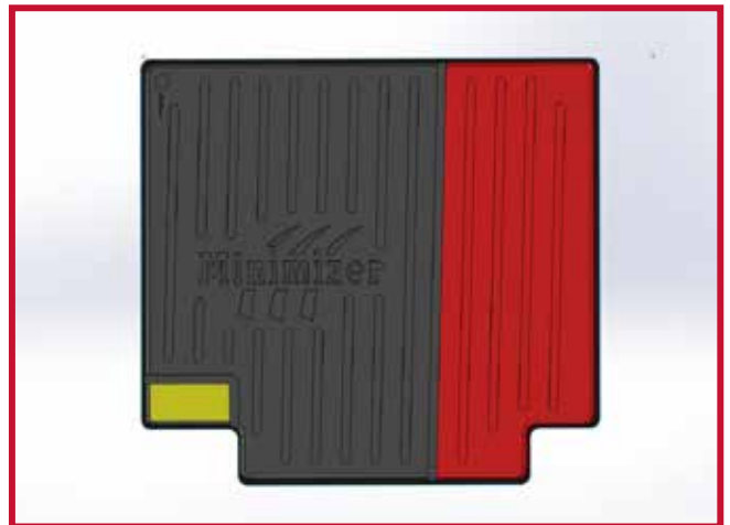
Figure 4 – Schéma de découpage

7. Ensuite, installer le tapis côté passager du véhicule.