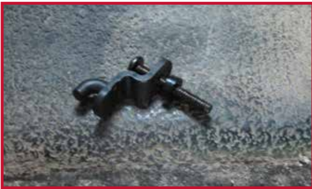
Figure 6 – Assemblage de crochet et d'espaceur

c) Insérer l'assemblage de crochet dans le couvercle de la boîte de vitesses, puis serrer à l'aide d'un tournevis Phillips n° 3. Orienter le crochet du tapis protecteur de manière à ce qu'il pointe directement vers le levier de vitesse, comme montré à la Figure 7.