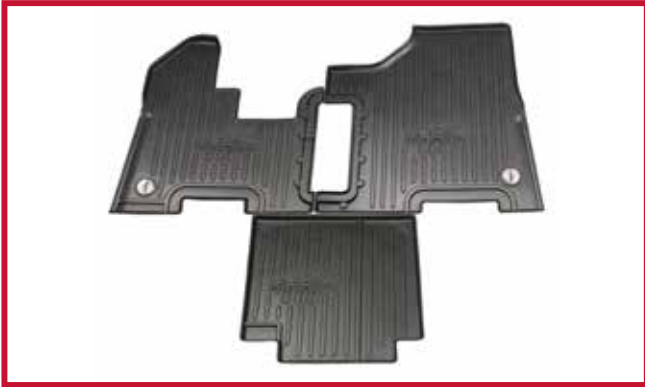
Figure 1 – Contenu de la trousse 10002702