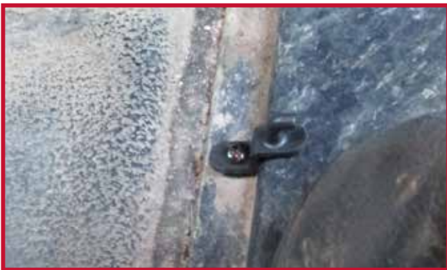
Figure 7 – Orientation appropriée du crochet

9. Installer le tapis protecteur côté conducteur, puis l'engager dans le crochet de retenue. Si l'emplacement de la base du siège n'est pas standard ou si le camion est équipé de sièges du marché de l'après-vente, il peut être nécessaire de découper la partie arrière du tapis côté conducteur ou côté passager pour assurer un ajustement adéquat. Une nervure surélevée est moulée dans le tapis côté conducteur et le tapis côté passager pour le confinement des liquides et pour servir de guide de découpage. Utiliser un couteau à lame rétractable bien aiguisée, comme montré à la Figure 8, pour découper le matériau et couper le long du bord extérieur de la nervure surélevée en préservant la nervure pour le confinement des liquides.