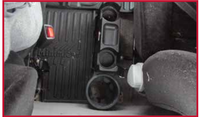
Figure 3 – Porte-bouteille isolante d'usine

6. Dans les cas où un extincteur est monté derrière le siège du conducteur, le coin arrière gauche ombré jaune du tapis central peut être découpé pour permettre un dégagement.