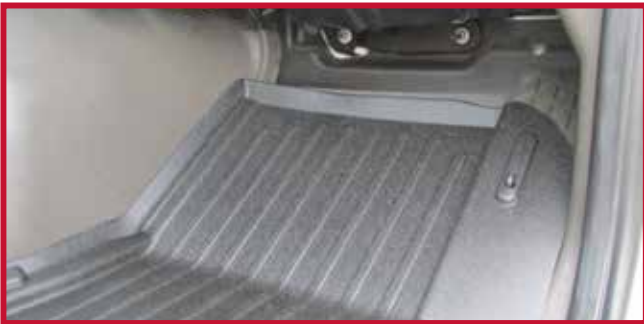
Figure 12 – Tapis côté conducteur et crochet correctement installés

Pour tous les autres cas, installer le crochet sur le panneau de finition de la section de jonction, comme montré à la Figure 13.