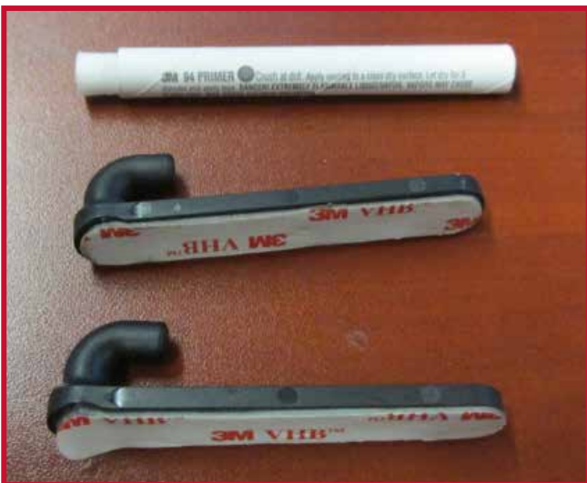
Figure 9 – Crochets de retenue et Apprêt 94

7. Insérer un crochet dans le trou situé dans le coin arrière droit du tapis protecteur côté conducteur. Le crochet doit être placé à affleurement de la face inférieure du tapis protecteur.