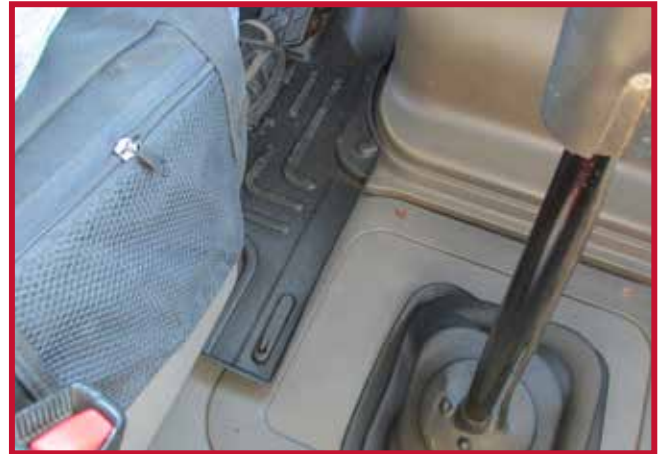
Figure 10 – Installation du crochet du tapis côté conducteur

Marquer l'emplacement approximatif où le crochet doit être fixé au plancher. Une fois l'emplacement localisé, retirer le tapis côté conducteur du camion.