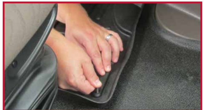
Figure 11 – Tapis côté conducteur et crochet correctement installés

14. Tout en tenant le cou du crochet, abaisser le tapis côté conducteur en place, puis coller le crochet au plancher. Appliquer une pression ferme sur le crochet, comme montré à la Figure 7, pendant 30 secondes pour assurer une bonne adhérence au plancher en caoutchouc.