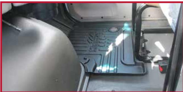
Figure 13 – Crochet de tapis côté passager installé sur le panneau de finition de la section de jonction

17. Confirmer que le crochet de retenue est entièrement engagé dans le tapis côté conducteur et que le crochet est collé au plancher. Si le crochet du tapis côté conducteur ne fonctionne pas correctement ou si le tapis ne peut pas être installé de manière sûre, ne pas utiliser de tapis protecteur Minimizer du côté conducteur du véhicule.