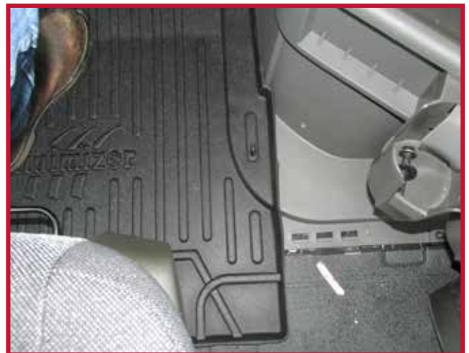
Figure 7 – Installation du crochet du tapis côté conducteur

18. Tirer le tapis côté conducteur vers l'arrière du camion pour confirmer que le crochet est entièrement engagé dans le tapis et que le crochet est collé à la moulure. Si le crochet ne fonctionne pas correctement ou si le tapis ne peut pas être installé de manière sûre, ne pas utiliser de tapis protecteur Minimizer du côté conducteur du véhicule.