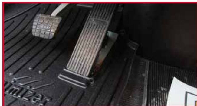
Figure 5 – Installation du tapis côté conducteur 10002853

• Dans certains cas, un boîtier électrique en acier ou en plastique sera monté au plancher dans le coin avant gauche de la cabine, comme montré à la Figure 6. Si le boîtier électrique est présent, la partie avant gauche du tapis côté conducteur devra être découpée à la main le long de la nervure surélevée. La zone à découper ombrée rouge est montrée à la Figure 7.