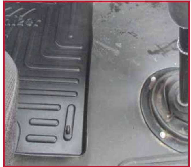
Figure 9 – Installation du crochet du tapis côté conducteur

9. Déballez le tube d'Apprêt 94 et lisez les consignes de sécurité imprimées sur le tube.