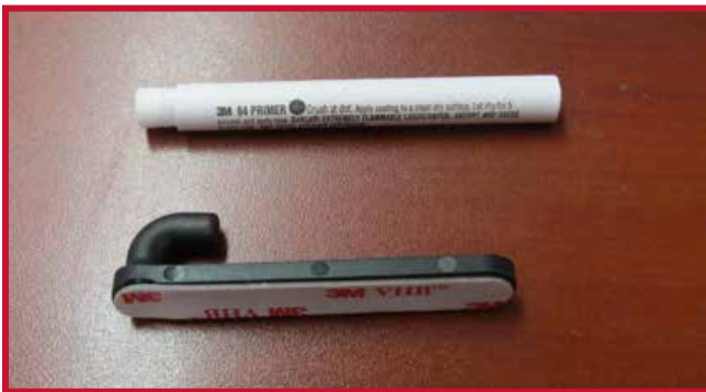
Figure 8 – Crochet et Apprêt 94

7. Insérer le crochet dans le trou situé dans le coin arrière droit du tapis protecteur côté conducteur. Le crochet doit être placé à affleurement de la face inférieure du tapis protecteur.