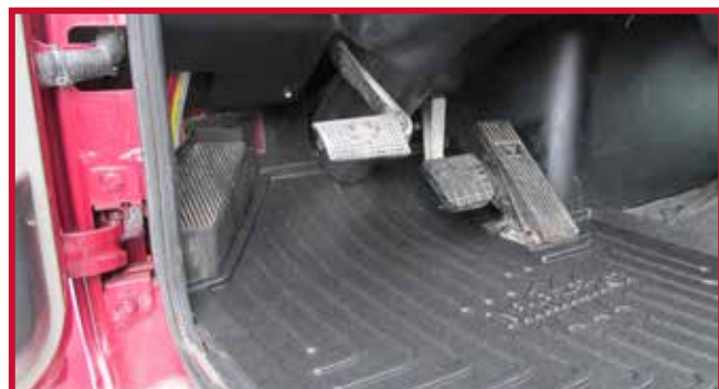
Figure 6 – Caisson électrique et tapis protecteur côté conducteur

• Dans certains cas, un boîtier électrique en acier ou en plastique sera monté au plancher dans le coin avant gauche de la cabine, comme montré à la Figure 6. Si le boîtier électrique est présent, la partie avant gauche du tapis côté conducteur devra être découpée à la main le long de la nervure surélevée. La zone à découper ombrée rouge est montrée à la Figure 7.