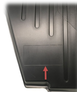
FIGURE 2 – BANDE À CROCHETS