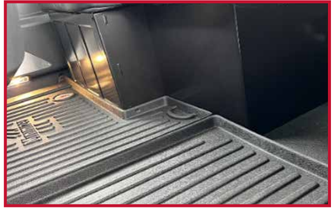
Figura 6 - Ubicación del gancho de retención con respaldo adhesivo