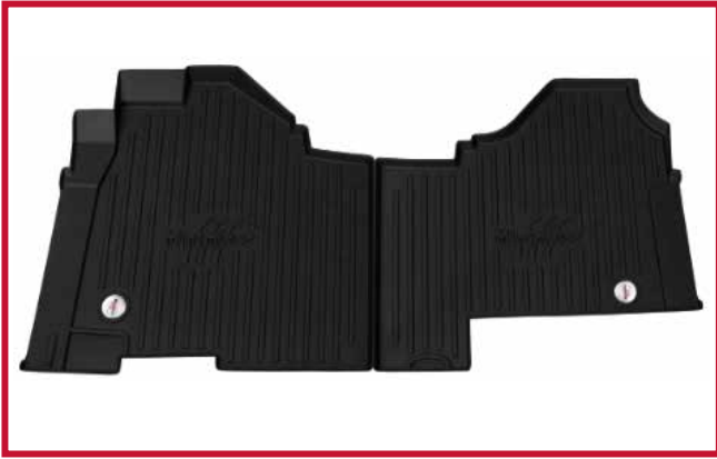
Figura 1 - Kit de tapetes 10006831