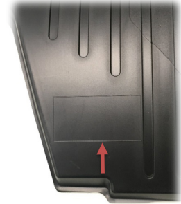
FIGURA 2 - TIRA DE GANCHOS