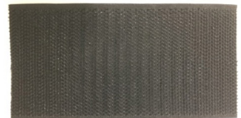
FIGURA 3 - TIRA DE VELCRO