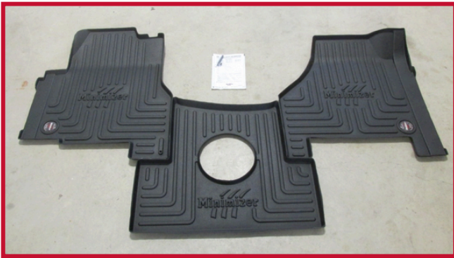
Figura 1 - Kit 10002358