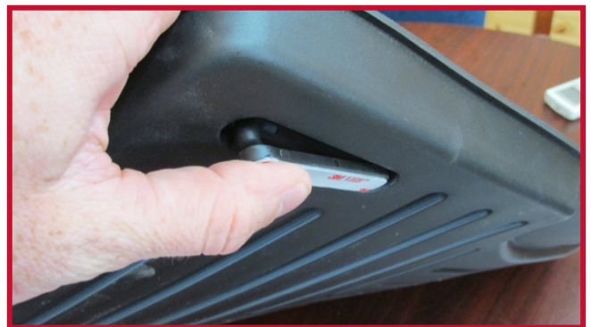
Figura 5 - Inserción del gancho