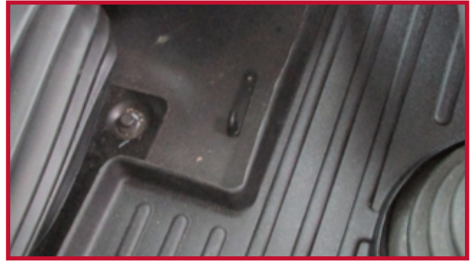
Figura 8 - Gancho de retención correctamente instalado

18. Instale el tapete del pasajero como se muestra en la figura 9.