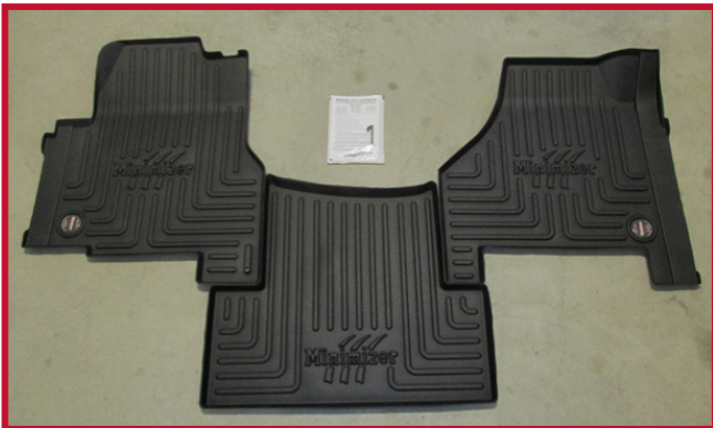
Figura 2 - Kit 10002342