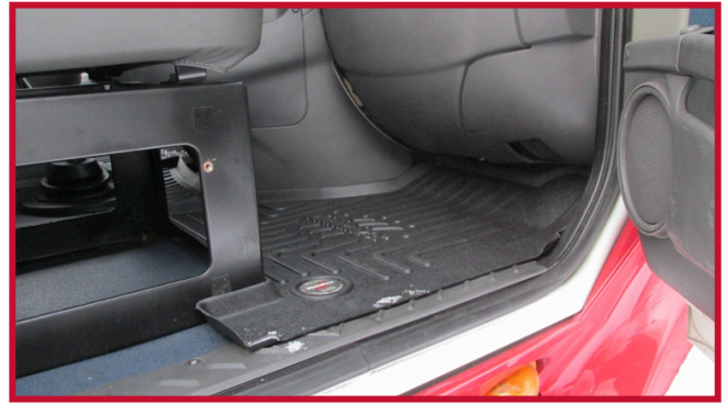
Figura 9 - Tapete de pasajero con asiento fijo

19. Tire del tapete del conductor hacia la parte delantera del camión para confirmar que el gancho está completamente encajado en el tapete y que el gancho está adherido al piso. Si el gancho no funciona correctamente o el tapete no puede instalarse de forma segura, no utilice un tapete Minimizer en el lado del conductor del vehículo.