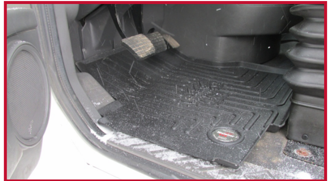
Figura 3 - Tapete del conductor en posición