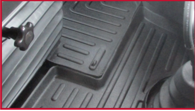
Figura 6 - Confirmar la ubicación del tapete del conductor y el gancho

10. Marque con un dedo la posición aproximada en la que deberá fijarse el gancho al piso. Una vez localizada la posición, retire el tapete del conductor del camión.