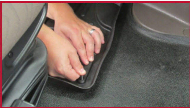
Figura 7 - Aplicar presión al gancho

17. Para una óptima adherencia, no mueva al gancho durante un período de 20 minutos después de la instalación. La figura 8 muestra la instalación correcta del gancho.