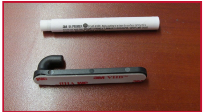
Figura 4 - Gancho y aplicación de Primer 94