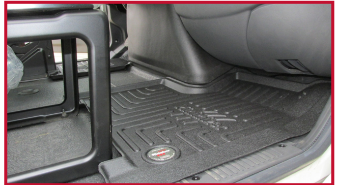
Figura 8 - Tapete de pasajero con asiento fijo

18. Tire del tapete del conductor hacia la parte delantera del camión para confirmar que el gancho está completamente encajado en el tapete y que el gancho está adherido al piso. Si el gancho no funciona correctamente o el tapete no puede instalarse de forma segura, no utilice un tapete Minimizer en el lado del conductor del vehículo.