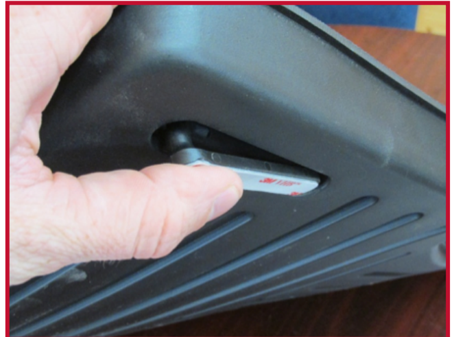
Figura 5 - Inserción del gancho