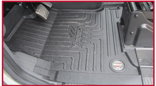
Figura 3 - Tapete del conductor en posición