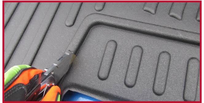
Figura 15 - Recorte del tapete del pasajero

13. Instale el gancho de retención del tapete del pasajero. Aplique Primer 94 en la zona mostrada en la figura 16 y repita el paso 7b anterior para fijar correctamente el gancho al umbral de plástico de la puerta. La figura 17 muestra una instalación correcta del gancho.