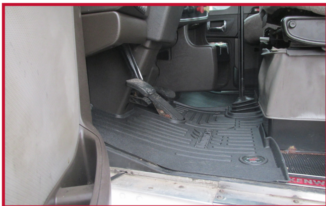
Figura 7 - Ajuste del tapete del conductor