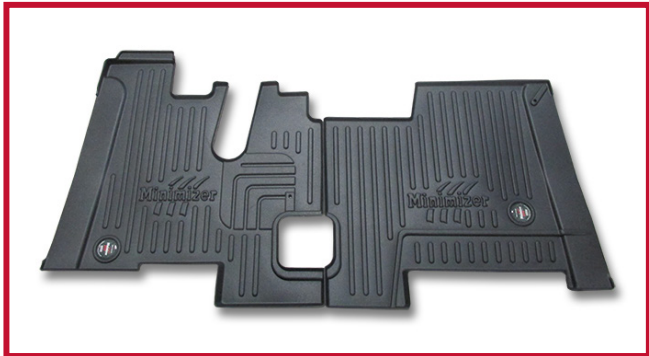
Figura 4 - Kit de tapete #10002508