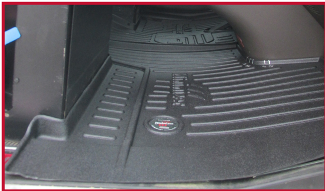
Figura 13 - Ajuste del tapete del pasajero

• Si el camión está equipado con un asiento de pasajero con caja de batería debajo del asiento, como se muestra en la figura 14, el tapete del pasajero debe recortarse para que encaje correctamente.