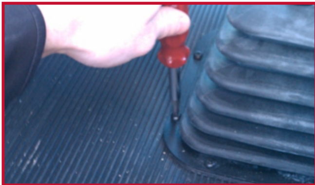
Figura 8 - Retire el tornillo de la bota de la palanca de cambios

• Introduzca el tornillo a través del orificio del gancho de retención como se muestra en la figura 7.