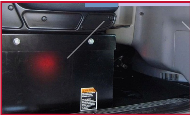
Figura 2 - Asiento del pasajero con almacenamiento de la batería

• Los tapetes del lado del pasajero no son compatibles con un asiento de pasajero de base fija con almacenamiento de batería bajo el asiento. Consulte la Figura 2 a continuación para ver la foto del asiento con almacenamiento de la batería.