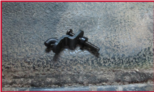
Figura 7 - Conjunto de gancho y espaciador

c) Introduzca el conjunto del gancho a través de la tapa de la transmisión y apriételo con un destornillador Phillips nº 3. Oriente el gancho del tapete para que apunte directamente hacia la palanca de cambios, como se muestra en la figura 8.