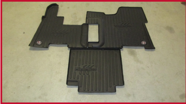
Figura 1 - Contenido del KIT 10002688

• Los camiones equipados con un soporte de termo de fábrica requieren el recorte manual del tapete central. Se ha moldeado una línea de recorte en relieve en el tapete para utilizarla como guía y para la contención de líquidos.