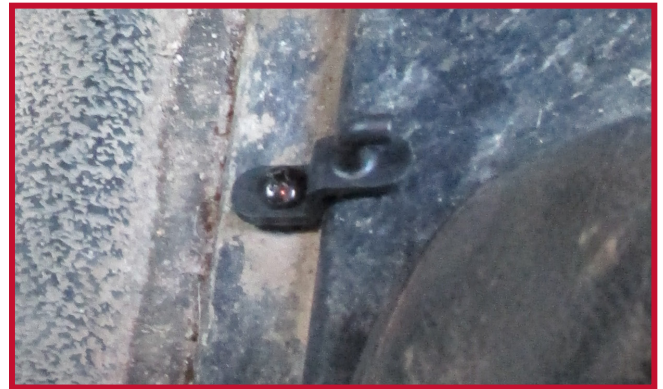
Figura 8 - Orientación correcta del gancho

9. Instale el tapete del lado del conductor y engánchelo en el gancho de retención. El tapete del conductor debe empujarse completamente hacia delante para que el borde delantero haga pleno contacto con los paneles inferiores del salpicadero. Acomode el borde trasero izquierdo del tapete del pasajero sobre la parte superior del borde trasero derecho del tapete del conductor.