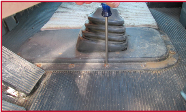
Figura 6 - Extracción del tornillo

b) Localice el gancho de retención; el espaciador de poliéster y el tornillo de máquina de 1/4 "x 1.75"; se muestra en la figura 7. Inserte el tornillo a través del orificio del gancho de retención y coloque el espaciador de poliéster negro en el perno debajo del gancho.