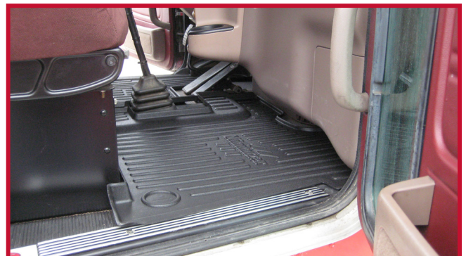
Figura 5 - Ajuste del tapete del pasajero

7. A continuación, instale el tapete para el lado del pasajero del vehículo como se muestra en la figura 5.