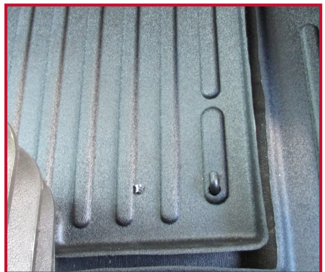
Figure 8 – Installation du crochet du tapis côté conducteur

17. Pour une adhérence optimale, ne pas déranger le crochet pendant une période de 20 minutes après l'installation. La Figure 8 ci-dessous montre le tapis côté conducteur et le crochet correctement installés.