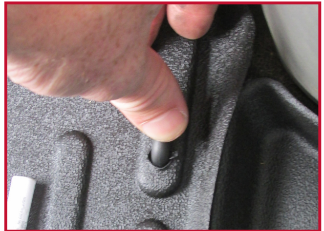
Figure 7 – Appliquer une pression sur le crochet

17. Pour une adhérence optimale, ne pas déranger le crochet pendant une période de 20 minutes après l'installation. La Figure 8 ci-dessous montre le tapis côté conducteur et le crochet correctement installés.