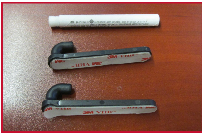
Figure 6 – Crochet de retenue et Apprêt 94

8. Insérer un crochet dans le trou situé au bord droit du tapis côté conducteur. Le crochet doit être placé à affleurement de la face inférieure du tapis côté conducteur.