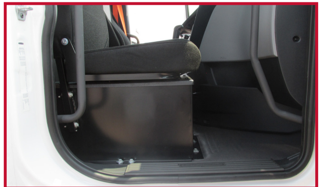
Figure 5 – Découpage du tapis central pour le caisson de batterie