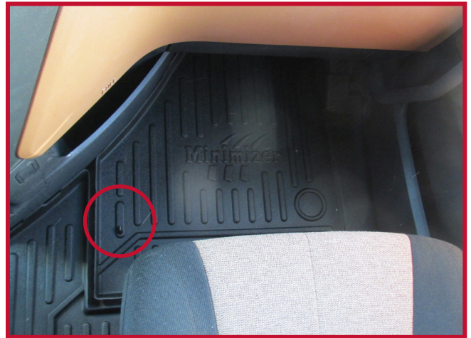
Figure 10 – Emplacement du crochet de retenue du tapis côté passager

23. Avant d'utiliser le véhicule, lire les Consignes de sécurité relatives au fonctionnement du véhicule.