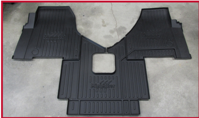
Figure 1 – Contenu de la trousse 10002331