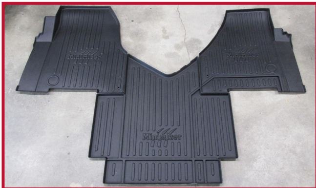
Figure 2 – Contenu de la trousse 10002323