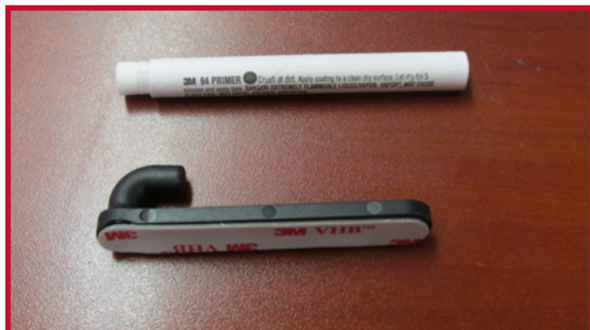
Figure 4 – Crochet et Apprêt 94