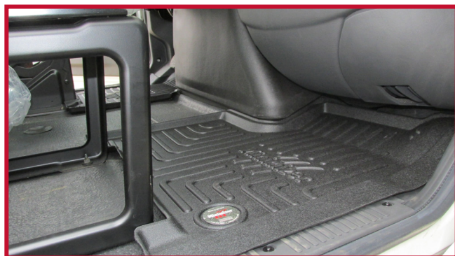
Figure 8 – Tapis côté passager avec siège fixe

18. Tirer le tapis côté conducteur vers l'avant du camion pour confirmer que le crochet est entièrement engagé dans le tapis et que le crochet est collé au plancher. Si le crochet ne fonctionne pas correctement ou si le tapis ne peut pas être installé de manière sûre, ne pas utiliser de tapis protecteur Minimizer du côté conducteur du véhicule.