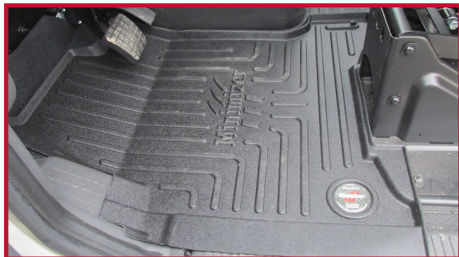
Figure 3 – Tapis côté conducteur en place