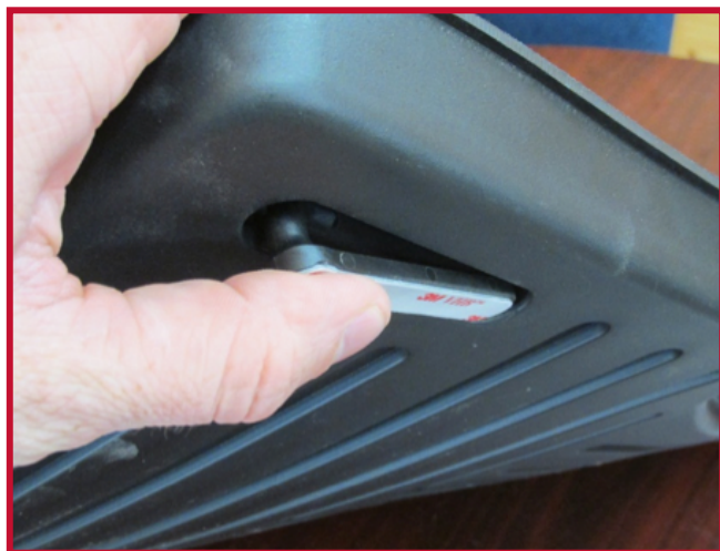
Figure 5 – Insertion du crochet