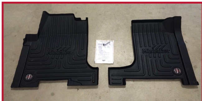
Figure 2 – Contenu de la trousse 10002433