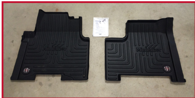
Figure 1 – Contenu de la trousse 10002412