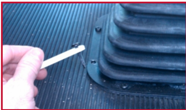
Figure 9 – Installer le crochet sur la vis existante

• Remettre la vis dans le trou d'origine, puis serrer. Orienter le crochet du tapis protecteur de manière à ce qu'il pointe vers l'avant du camion.