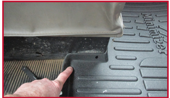
Figure 10 – Emplacement du crochet du tapis côté conducteur

• Retirer le tapis côté conducteur du camion. • Activer le tube d'Apprêt 94 en écrasant le tube au niveau du point noir. • Appliquer de l'Apprêt 94 sur la base noire du siège où le crochet sera collé, comme montré à la Figure 11.