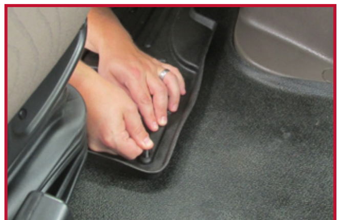
Figure 12 – Appliquer une pression sur le crochet

• Laisser sécher l'Apprêt 94 sur la surface de la base du siège pendant 5 minutes. • Avec le crochet inséré, installer le tapis côté conducteur dans le camion. • Retirer la doublure en papier de l'adhésif du crochet, puis coller le crochet à la base du siège. La pointe ronde du crochet doit être orientée vers l'arrière du camion. • Une fois le crochet en place, appliquer une pression ferme sur le crochet, comme montré à la Figure 12, pendant 30 secondes. Cela permettra d'assurer une adhérence adéquate avec la base du siège. • Pour une adhérence optimale, ne pas déranger le crochet pendant une période de 20 minutes après l'installation.