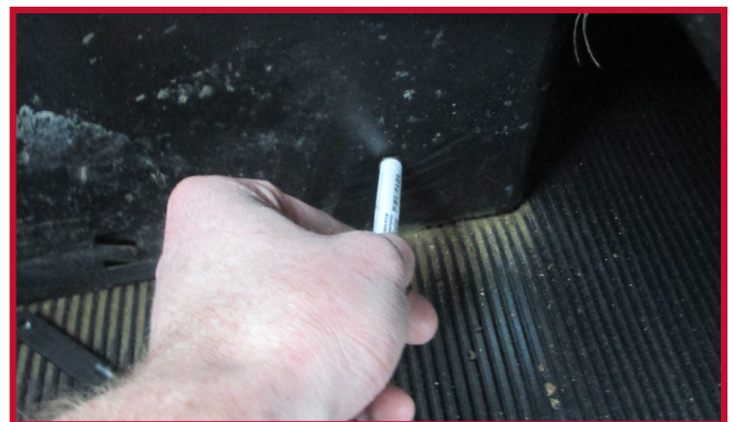
Figure 11 – Appliquer de l'Apprêt 94 sur la base du siège

• Laisser sécher l'Apprêt 94 sur la surface de la base du siège pendant 5 minutes. • Avec le crochet inséré, installer le tapis côté conducteur dans le camion. • Retirer la doublure en papier de l'adhésif du crochet, puis coller le crochet à la base du siège. La pointe ronde du crochet doit être orientée vers l'arrière du camion. • Une fois le crochet en place, appliquer une pression ferme sur le crochet, comme montré à la Figure 12, pendant 30 secondes. Cela permettra d'assurer une adhérence adéquate avec la base du siège. • Pour une adhérence optimale, ne pas déranger le crochet pendant une période de 20 minutes après l'installation.