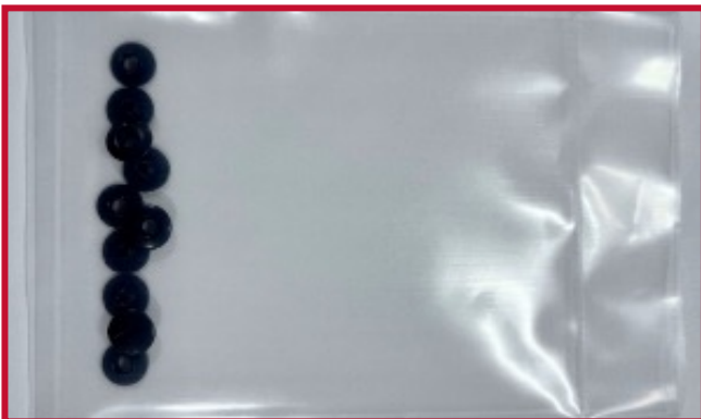
Figura 2: Paquete de herrajes para barril de unión