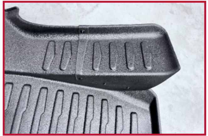
Figura 3: Extensión del posapiés fijado

(NOTA: El tapete del lado del conductor se puede utilizar sin la extensión del posapiés si se desea.)