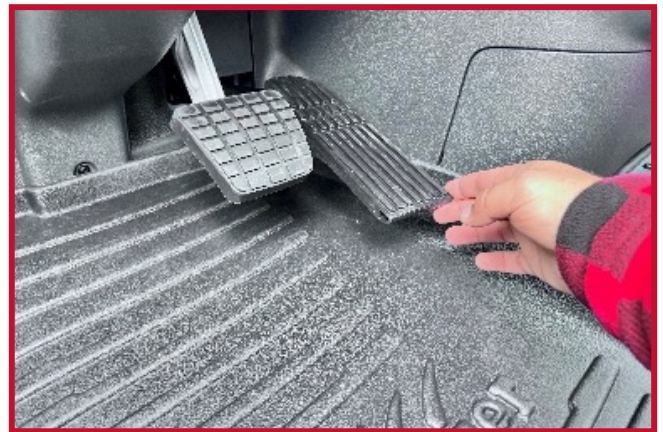
Figura 4: Tapete del conductor en su posición