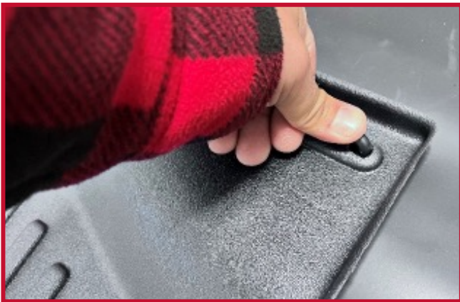
Figura 6: Aplique presión al gancho.

17. Para una adhesión óptima, no toque el gancho durante 20 minutos después de la instalación.