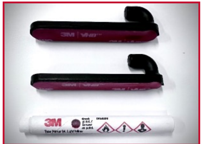
Figura 5: Gancho de retención y Primer 94