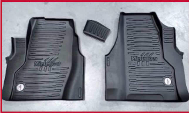
Figura 1: Contenido del kit # 10045112.